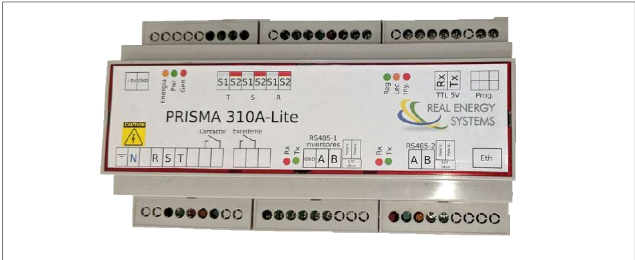
Figura 1 PRISMA 310AL - un controlador dinámico de potencia con inyección CERO para pequeñas instalaciones

Con cumplimiento de los criterios de la UNE 217001-IN